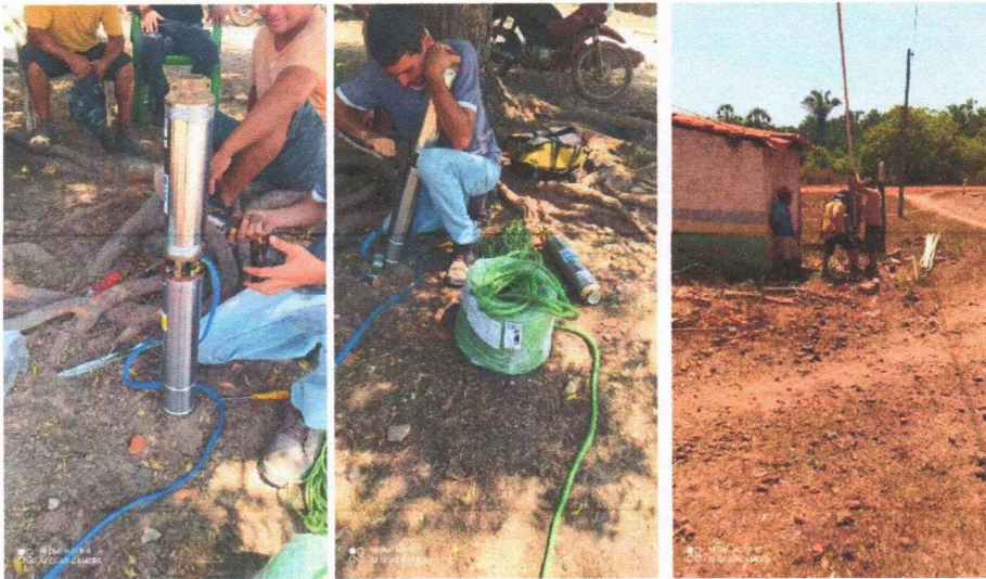
Imagem 07 – Desmontagem do equipamento submerso; conj. Moto-bomba submersa; montagem e instalação de conjunto moto-bomba submersível (eixo vertical) em poços tubulares; abraçadeira de nylon para amarração de cabos e teste de produção com bomba; distribuição de rede de água; instalação de reservatório.