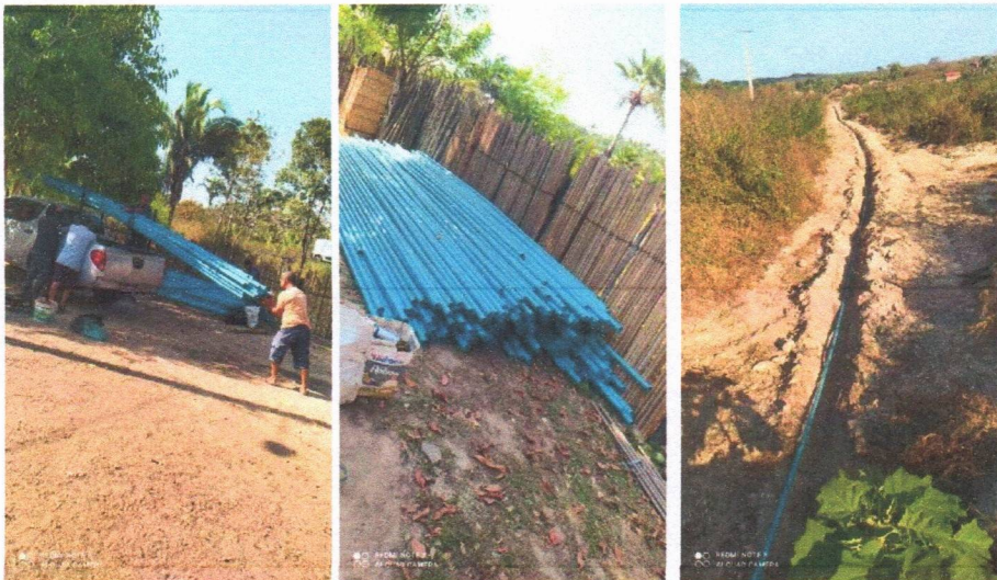
Imagem 08 – Desmontagem do equipamento submerso; conj. Moto-bomba submersa; montagem e instalação de conjunto moto-bomba submersível (eixo vertical) em poços tubulares; abraçadeira de nylon para amarração de cabos e teste de produção com bomba; distribuição de rede de água; instalação de reservatório.