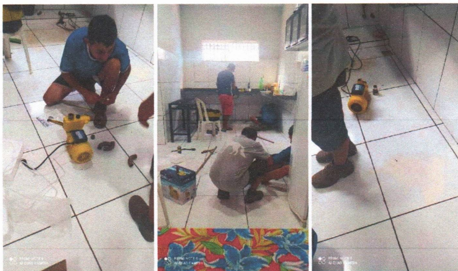
Imagem 08 – Desmontagem do equipamento submerso; conj. Moto-bomba submersa; montagem e instalação de conjunto moto-bomba submersível (eixo vertical) em poços tubulares; abraçadeira de nylon para amarração de cabos e teste de produção com bomba; distribuição de rede de água; instalação de reservatório.

LOCALIDADE: U.E SEBASTIÃO JOSÉ RODRIGUES DA MATA (BREJO DO MEIO)