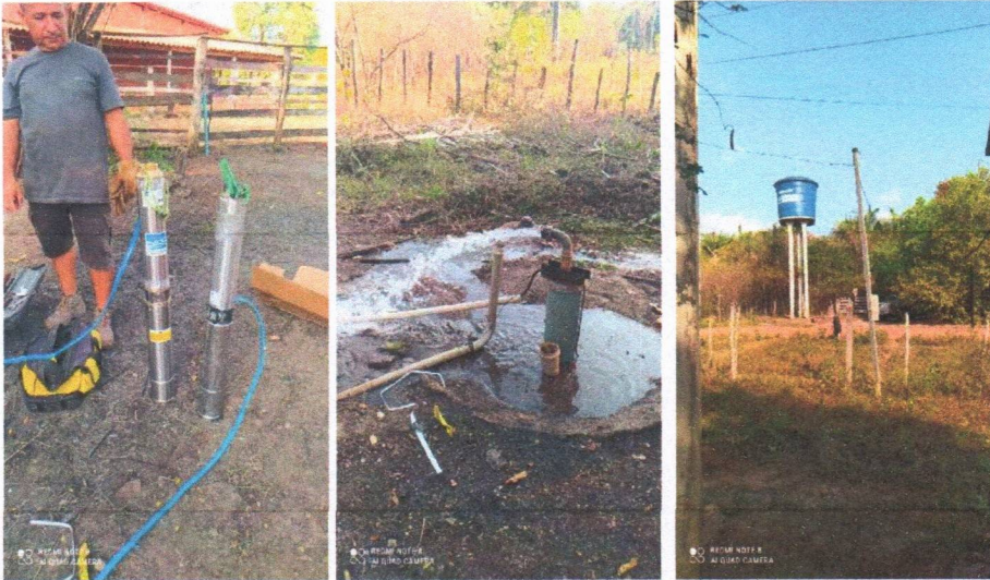
Imagem 05 – Desmontagem do equipamento submerso; conj. Moto-bomba submersa; montagem e instalação de conjunto moto-bomba submersível (eixo vertical) em poços tubulares; abraçadeira de nylon para amarração de cabos e teste de produção com bomba; distribuição de rede de água; instalação de reservatório.