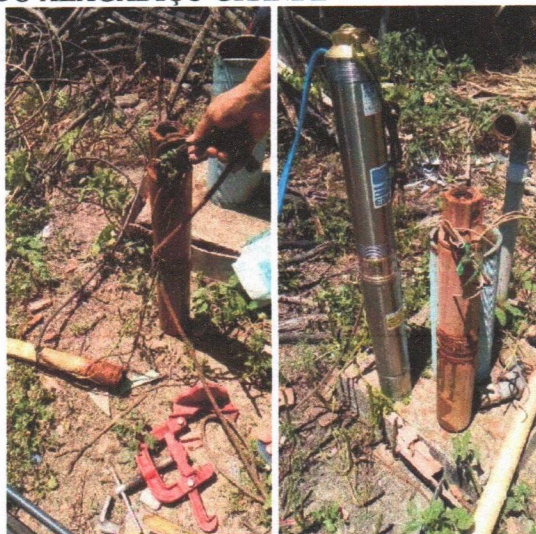
Imagem 02 – Desmontagem do equipamento submerso; conj. Moto-bomba submersa; montagem e instalação de conjunto moto-bomba submersível (eixo vertical) em poços tubulares; abraçadeira de nylon para amarração de cabos e teste de produção com bomba; distribuição de rede de água; instalação de reservatório.