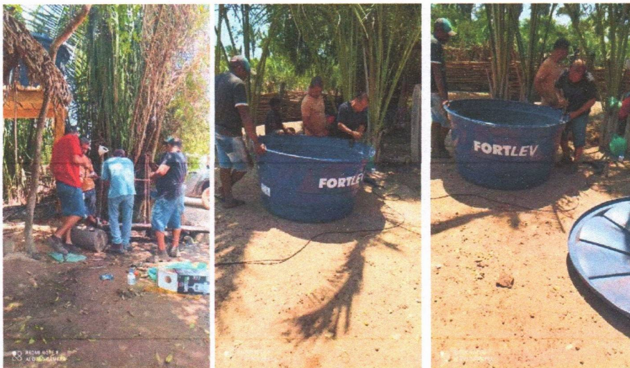
Imagem 06 – Desmontagem do equipamento submerso; conj. Moto-bomba submersa; montagem e instalação de conjunto moto-bomba submersível (eixo vertical) em poços tubulares; abraçadeira de nylon para amarração de cabos e teste de produção com bomba; distribuição de rede de água; instalação de reservatório.