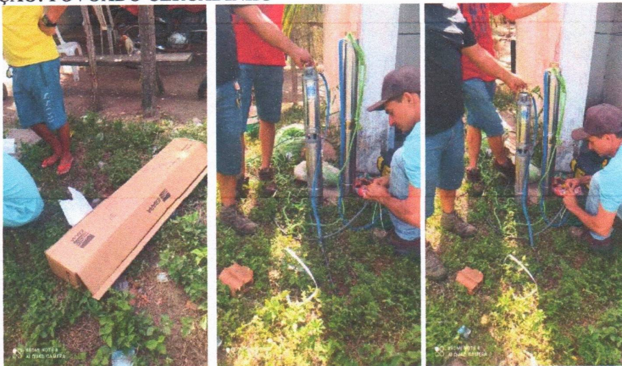
Imagem 01 – Desmontagem do equipamento submerso; conj. Moto-bomba submersa; montagem e instalação de conjunto moto-bomba submersível (eixo vertical) em poços tubulares; abraçadeira de nylon para amarração de cabos e teste de produção com bomba; distribuição de rede de água; instalação de reservatório.