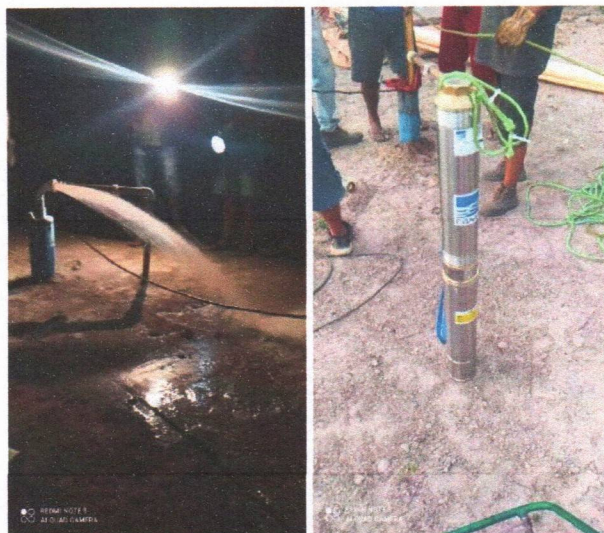
Imagem 07 – Desmontagem do equipamento submerso; conj. Moto-bomba submersa; montagem e instalação de conjunto moto-bomba submersível (eixo vertical) em poços tubulares; abraçadeira de nylon para amarração de cabos e teste de produção com bomba; distribuição de rede de água; instalação de reservatório.

LOCALIDADE: U.E SEBASTIÃO JOSÉ RODRIGUES DA MATA (BREJO DO MEIO)