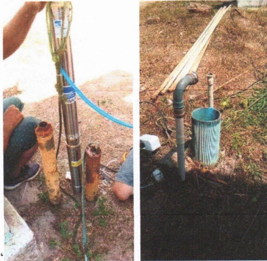
Imagem 03 – Desmontagem do equipamento submerso; conj. Moto-bomba submersa; montagem e instalação de conjunto moto-bomba submersível (eixo vertical) em poços tubulares; abraçadeira de nylon para amarração de cabos e teste de produção com bomba; instalação de quadro.