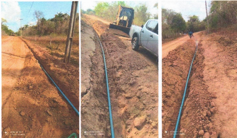
Imagem 04 – Desmontagem do equipamento submerso; conj. Moto-bomba submersa; montagem e instalação de conjunto moto-bomba submersível (eixo vertical) em poços tubulares; abraçadeira de nylon para amarração de cabos e teste de produção com bomba; distribuição de rede de água; instalação de reservatório.