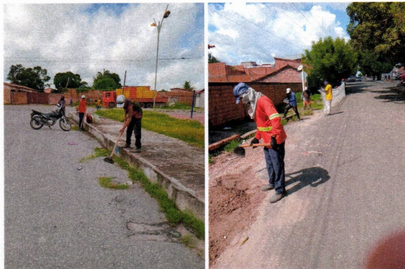
Imagem 04 – equipe realizando limpeza de ruas (varrição e remoção de entulhos), limpeza manual de vegetação em vias públicas e bota fora.