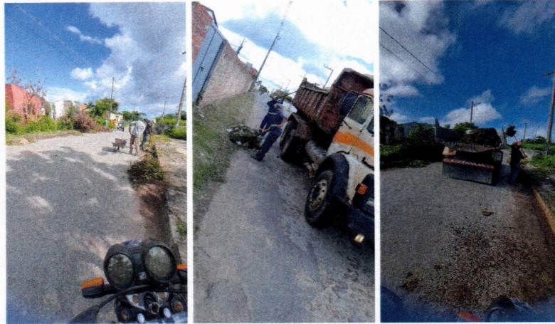
Imagem 03 – equipe realizando limpeza de ruas (varrição e remoção de entulhos), limpeza mecânica com roçadeira em vegetação em vias públicas.