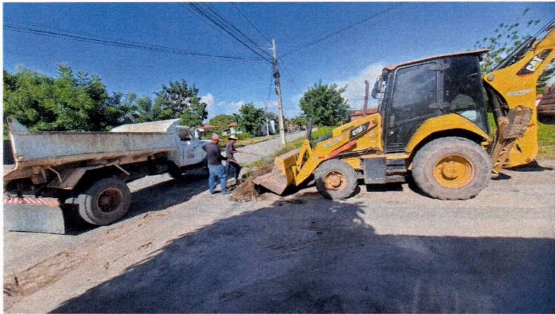
Imagem 01 – equipe realizando limpeza de ruas (varrição e remoção de entulhos), limpeza manual de vegetação com roçadeira em vias públicas e bota fora em caminhão basculante