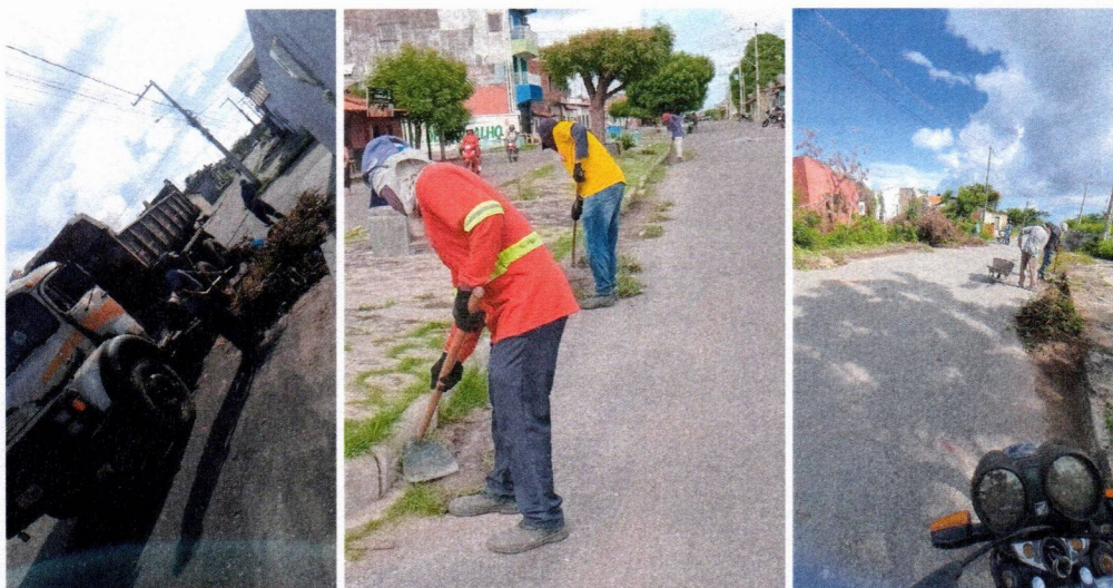
Imagem 05 – equipe realizando limpeza de ruas (varrição e remoção de entulhos), limpeza manual de vegetação em vias públicas e bota fora.