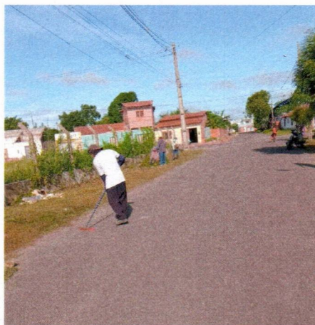
Imagem 02 – equipe realizando limpeza de ruas (varrição e remoção de entulhos), limpeza manual de vegetação com roçadeira em vias públicas e bota fora em caminhão basculante