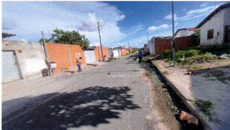
Imagem 02 – equipe realizando limpeza de ruas (varrição e remoção de entulhos), limpeza manual de vegetação com roçadeira em vias públicas e bota fora em caminhão basculante