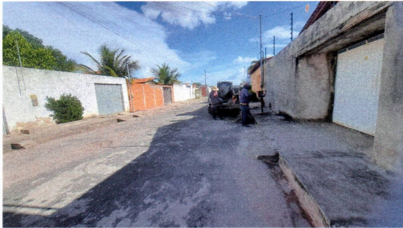
Imagem 01 – equipe realizando limpeza de ruas (varrição e remoção de entulhos), limpeza manual de vegetação com roçadeira em vias públicas e bota fora em caminhão basculante