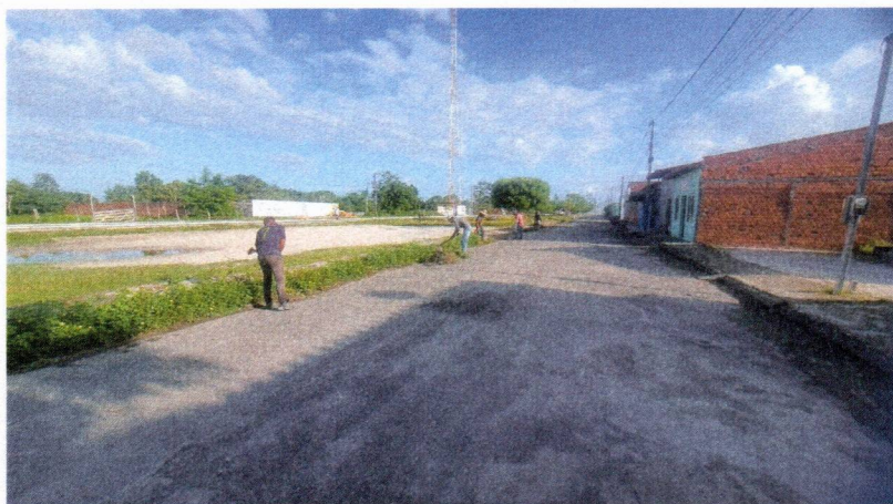
Imagem 03 – equipe realizando limpeza de ruas (varrição e remoção de entulhos), limpeza mecânica com roçadeira em vegetação em vias públicas.