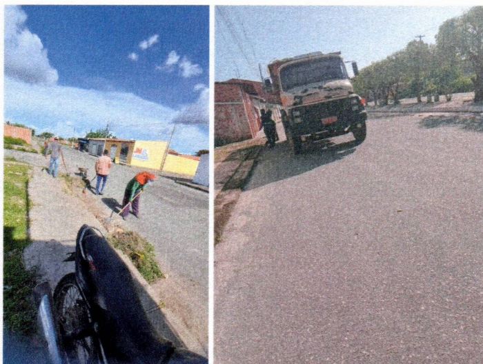
Imagem 05 – equipe realizando limpeza de ruas (varrição e remoção de entulhos), limpeza manual de vegetação em vias públicas e bota fora.