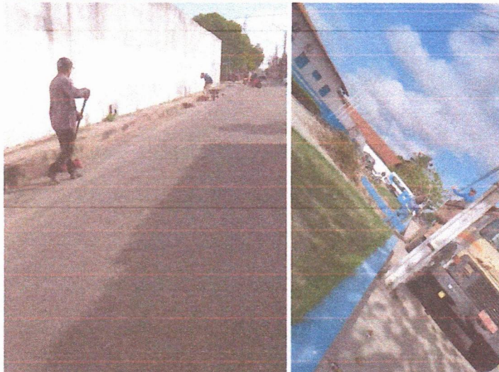
Imagem 03 – equipe realizando limpeza de ruas (varrição e remoção de entulhos), limpeza mecânica com roçadeira em vegetação em vias públicas.