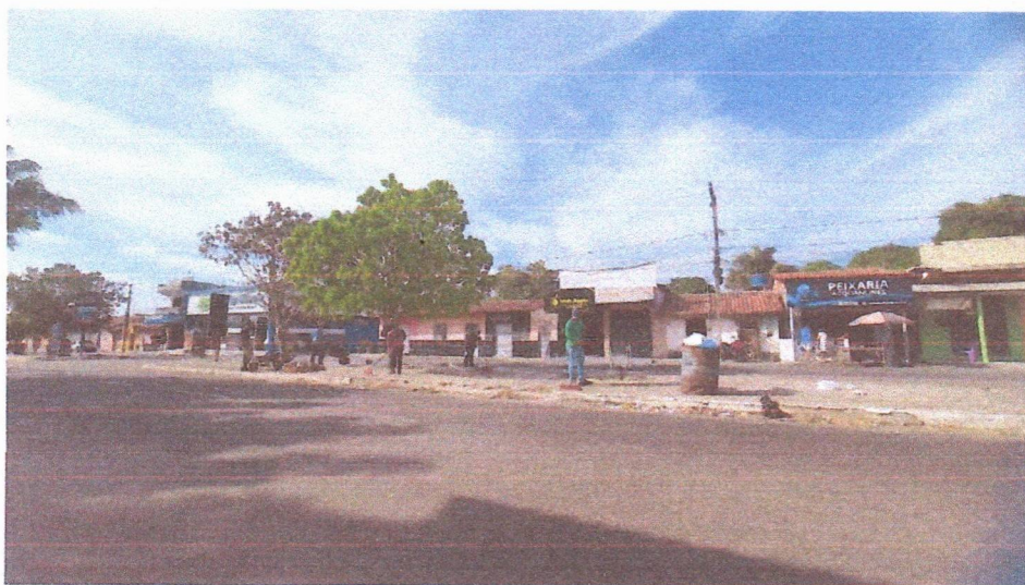
Imagem 04 – equipe realizando limpeza de ruas (varrição e remoção de entulhos), limpeza manual de vegetação em vias públicas e bota fora.