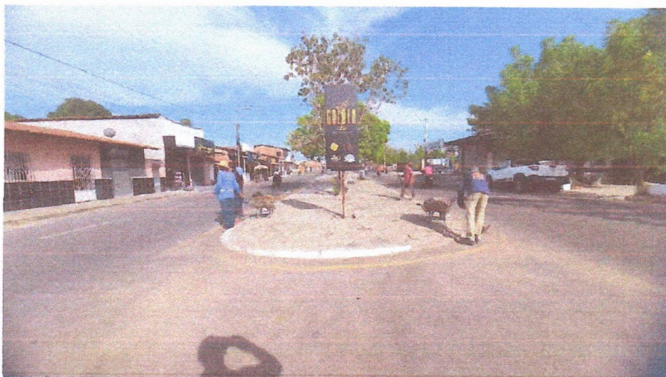
Imagem 05 – equipe realizando limpeza de ruas (varrição e remoção de entulhos), limpeza manual de vegetação em vias públicas e bota fora.