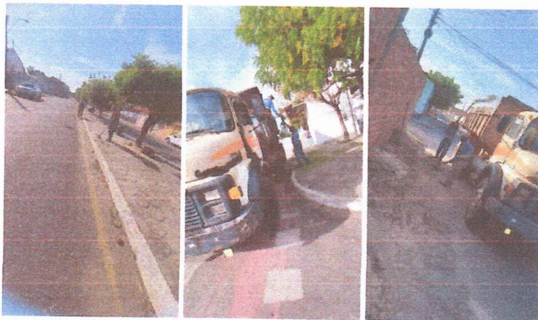
Imagem 02 – equipe realizando limpeza de ruas (varrição e remoção de entulhos), limpeza manual de vegetação com roçadeira em vias públicas e bota fora em caminhão basculante