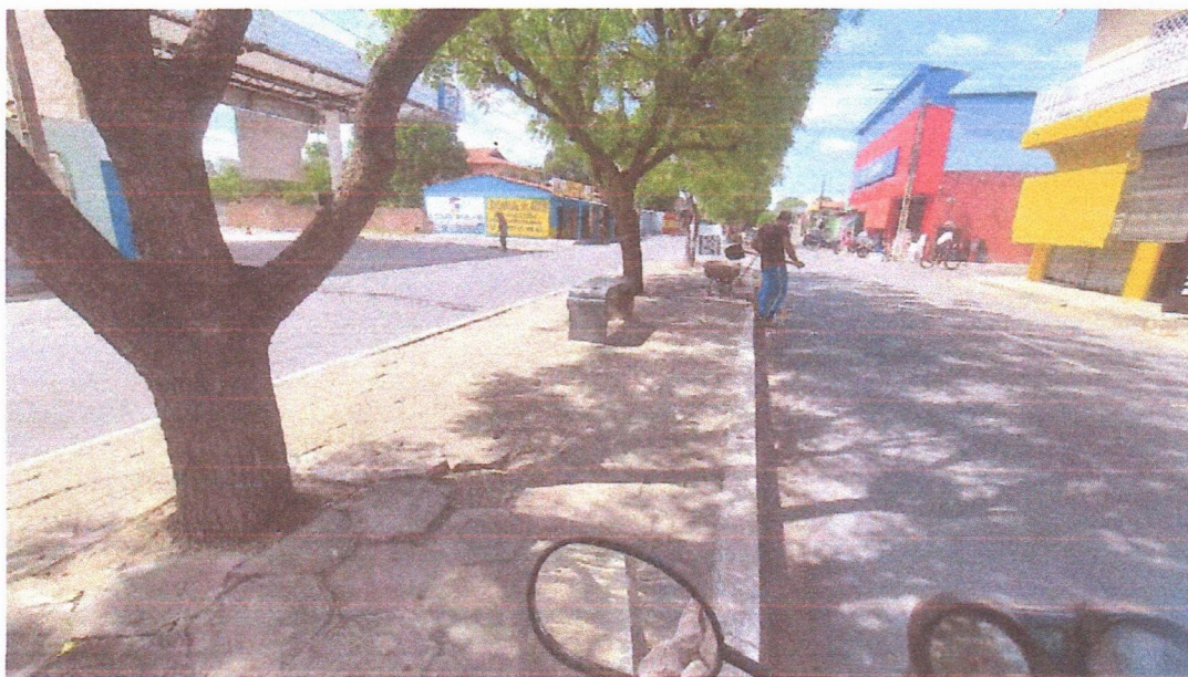
Imagem 07 – equipe realizando limpeza de ruas (varrição e remoção de entulhos), limpeza manual de vegetação em vias públicas e bota fora.