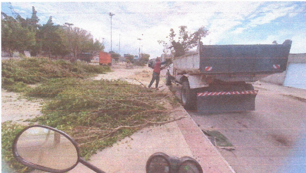
Imagem 06 – equipe realizando limpeza de ruas (varrição e remoção de entulhos), limpeza manual de vegetação em vias públicas e bota fora.