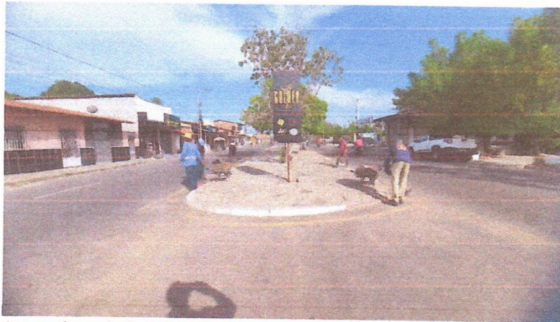
Imagem 01 – equipe realizando limpeza de ruas (varrição e remoção de entulhos), limpeza manual de vegetação com roçadeira em vias públicas e bota fora em caminhão basculante