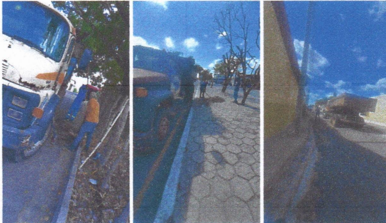
Imagem 04 – equipe realizando limpeza de ruas (varrição e remoção de entulhos), limpeza manual de vegetação em vias públicas e bota fora.