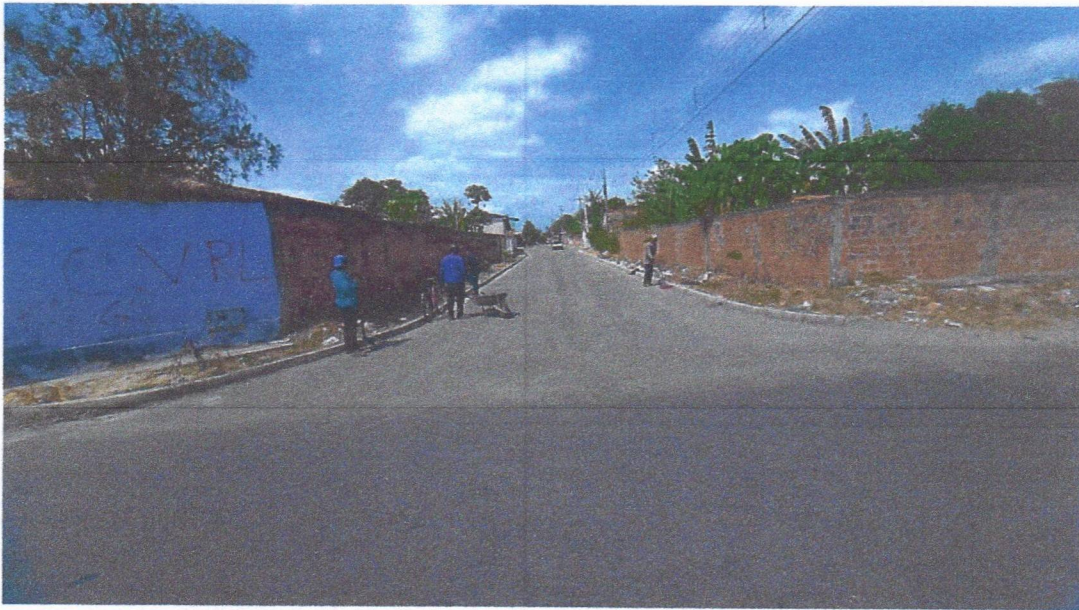
Imagem 01 – equipe realizando limpeza de ruas (varrição e remoção de entulhos), limpeza manual de vegetação com roçadeira em vias públicas e bota fora em caminhão basculante