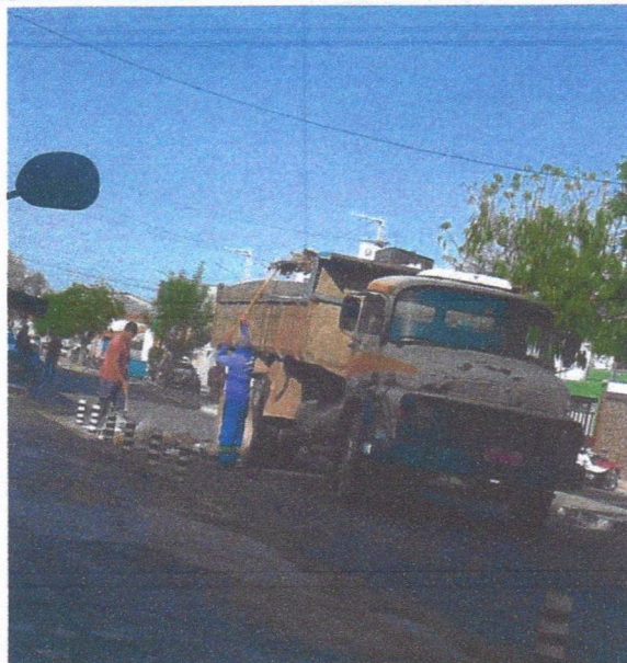
Imagem 06 – equipe realizando limpeza de ruas (varrição e remoção de entulhos), limpeza manual de vegetação em vias públicas e bota fora.