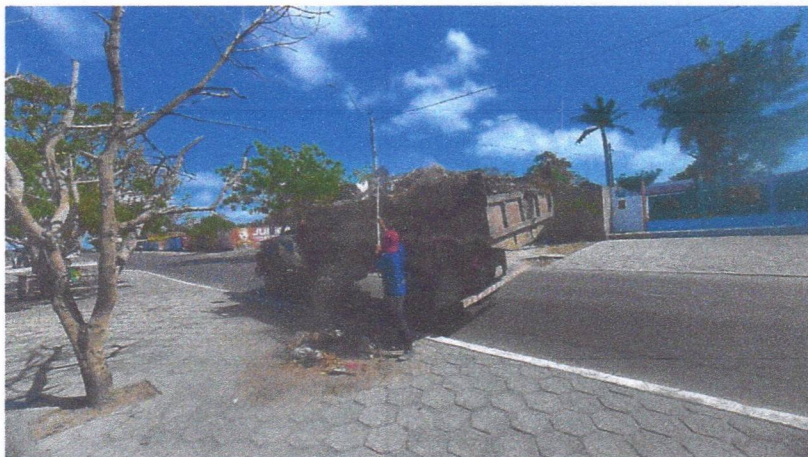
Imagem 05 – equipe realizando limpeza de ruas (varrição e remoção de entulhos), limpeza manual de vegetação em vias públicas e bota fora.