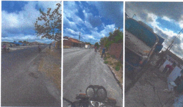
Imagem 02 – equipe realizando limpeza de ruas (varrição e remoção de entulhos), limpeza manual de vegetação com roçadeira em vias públicas e bota fora em caminhão basculante