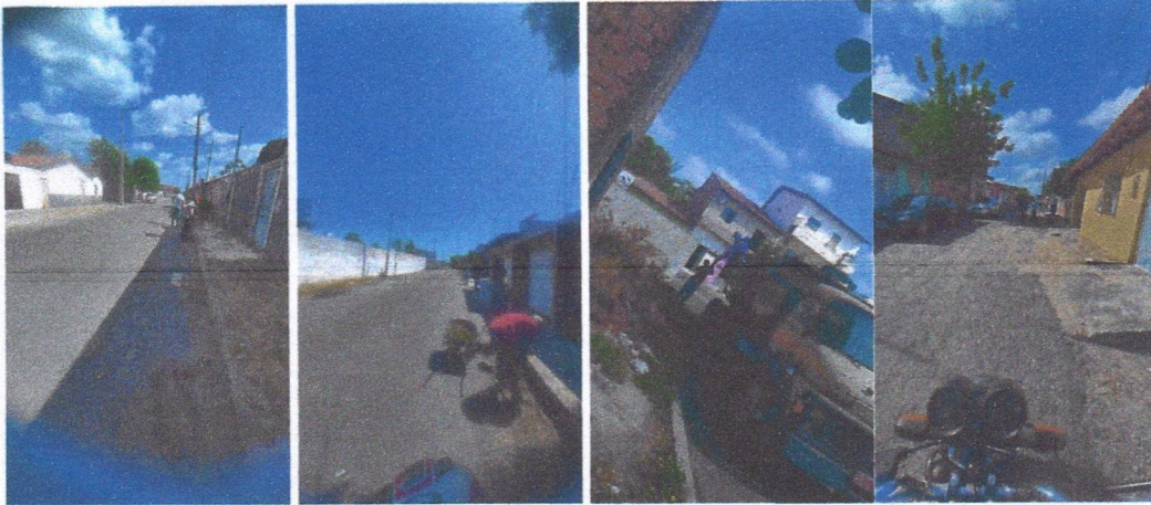
Imagem 03 – equipe realizando limpeza de ruas (varrição e remoção de entulhos), limpeza mecânica com roçadeira em vegetação em vias públicas.