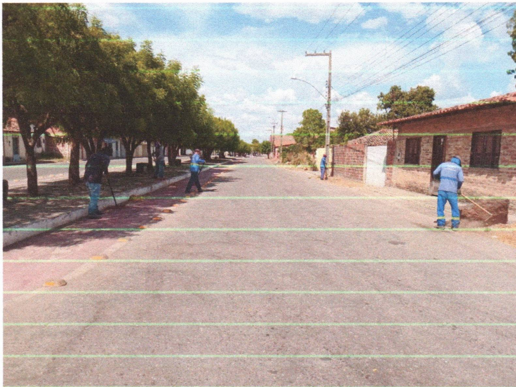
Imagem 07 – equipe realizando limpeza de ruas (varrição e remoção de entulhos), limpeza manual de vegetação em vias públicas e bota fora.