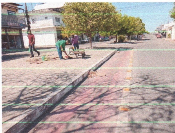
Imagem 01 – equipe realizando limpeza de ruas (varrição e remoção de entulhos), limpeza manual de vegetação com roçadeira em vias públicas e bota fora em caminhão basculante