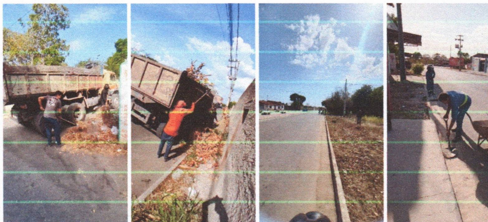
Imagem 04 – equipe realizando limpeza de ruas (varrição e remoção de entulhos), limpeza manual de vegetação em vias públicas e bota fora.