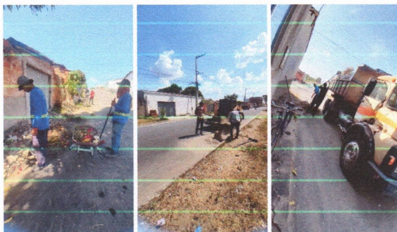
Imagem 02 – equipe realizando limpeza de ruas (varrição e remoção de entulhos), limpeza manual de vegetação com roçadeira em vias públicas e bota fora em caminhão basculante