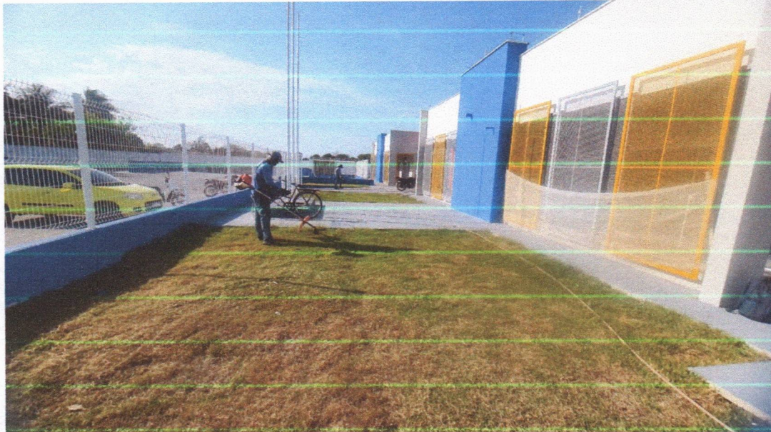
Imagem 06 – equipe realizando limpeza de ruas (varrição e remoção de entulhos), limpeza manual de vegetação em vias públicas e bota fora.