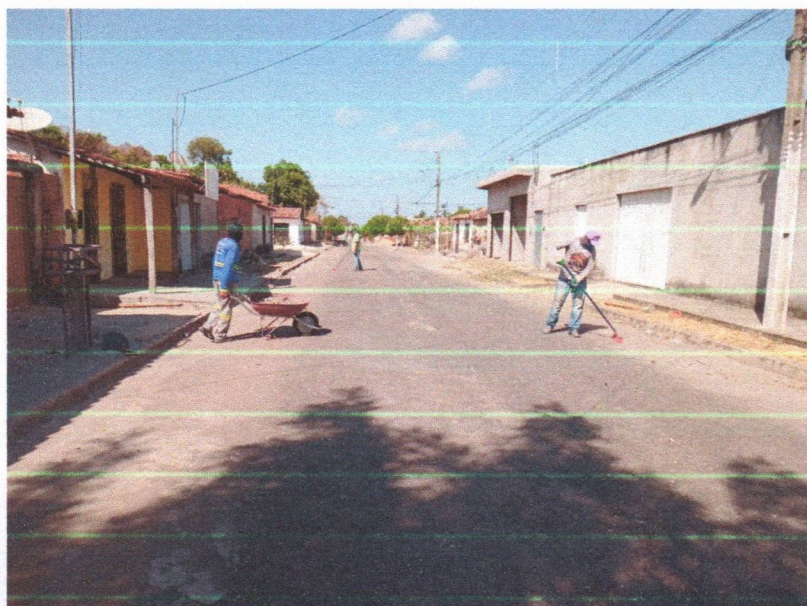
Imagem 05 – equipe realizando limpeza de ruas (varrição e remoção de entulhos), limpeza manual de vegetação em vias públicas e bota fora.