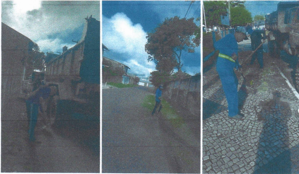
Imagem 03 – equipe realizando limpeza de ruas (varrição e remoção de entulhos), limpeza mecânica com roçadeira em vegetação em vias públicas.