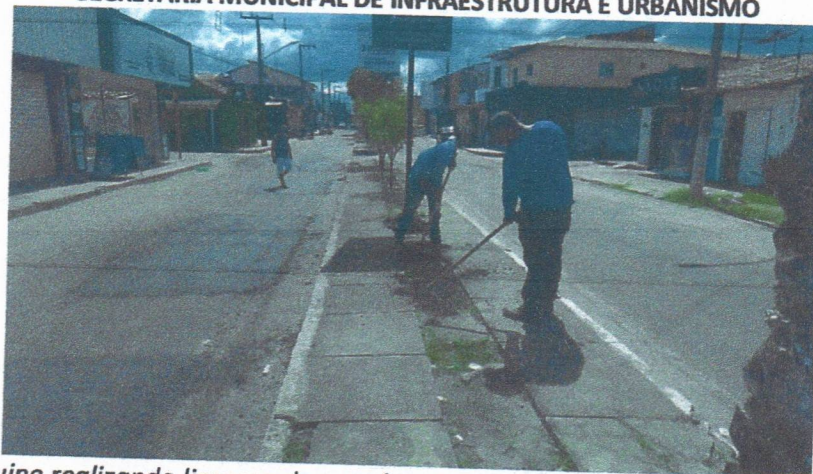
Imagem 05 – equipe realizando limpeza de ruas (varrição e remoção de entulhos), limpeza manual de vegetação em vias públicas e bota fora.