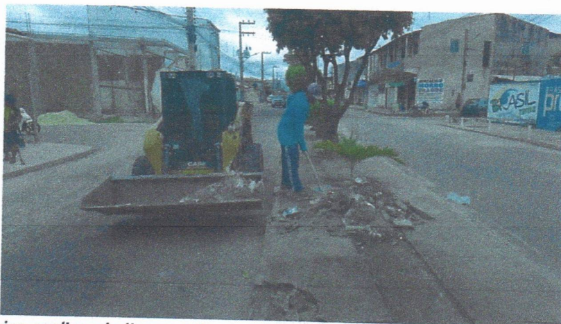
Imagem 01 – equipe realizando limpeza de ruas (varrição e remoção de entulhos), limpeza manual de vegetação com roçadeira em vias públicas e bota fora em caminhão basculante