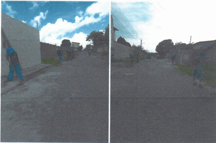
Imagem 04 – equipe realizando limpeza de ruas (varrição e remoção de entulhos), limpeza manual de vegetação em vias públicas e bota fora.