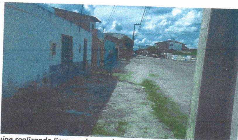
Imagem 06 – equipe realizando limpeza de ruas (varrição e remoção de entulhos), limpeza manual de vegetação em vias públicas e bota fora.