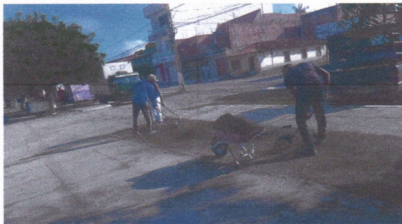
Imagem 06 – equipe realizando limpeza de ruas (varrição e remoção de entulhos), limpeza manual de vegetação em vias públicas e bota fora.