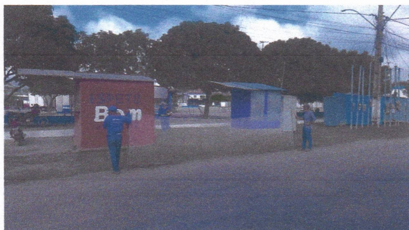
Imagem 06 – equipe realizando limpeza de ruas (varrição e remoção de entulhos), limpeza manual de vegetação em vias públicas e bota fora.