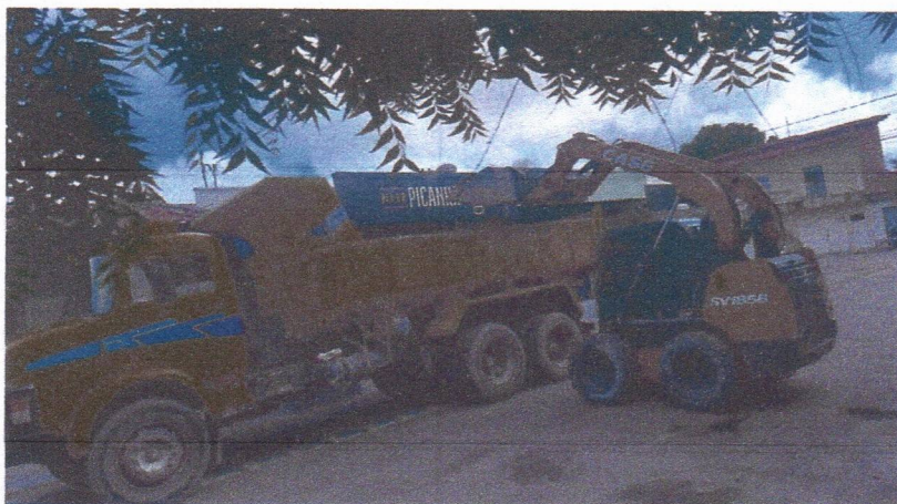
Imagem 01 – equipe realizando limpeza de ruas (varrição e remoção de entulhos), limpeza manual de vegetação com roçadeira em vias públicas e bota fora em caminhão basculante