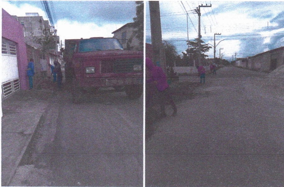
Imagem 04 – equipe realizando limpeza de ruas (varrição e remoção de entulhos), limpeza manual de vegetação em vias públicas e bota fora.