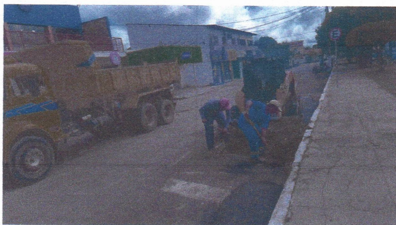
Imagem 02 – equipe realizando limpeza de ruas (varrição e remoção de entulhos), limpeza manual de vegetação com roçadeira em vias públicas e bota fora em caminhão basculante