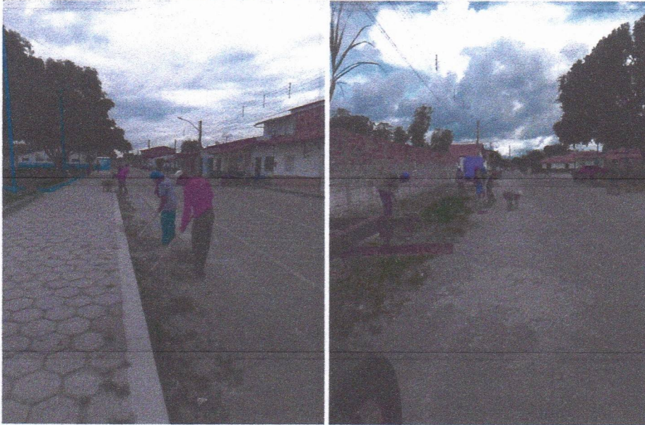
Imagem 03 – equipe realizando limpeza de ruas (varrição e remoção de entulhos), limpeza mecânica com roçadeira em vegetação em vias públicas.