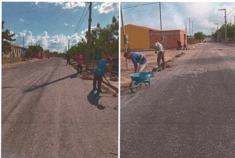
Imagem 04 – equipe realizando limpeza de ruas (varrição e remoção de entulhos), limpeza manual de vegetação em vias públicas e bota fora.