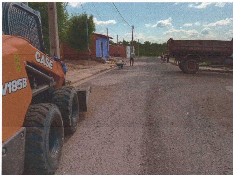
Imagem 02 – equipe realizando limpeza de ruas (varrição e remoção de entulhos), limpeza manual de vegetação com roçadeira em vias públicas e bota fora em caminhão basculante