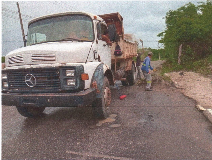
Imagem 01 – equipe realizando limpeza de ruas (varrição e remoção de entulhos), limpeza manual de vegetação com roçadeira em vias públicas e bota fora em caminhão basculante