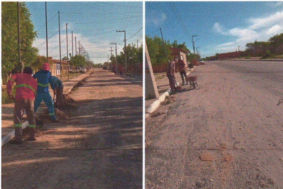
Imagem 03 – equipe realizando limpeza de ruas (varrição e remoção de entulhos), limpeza mecânica com roçadeira em vegetação em vias públicas.