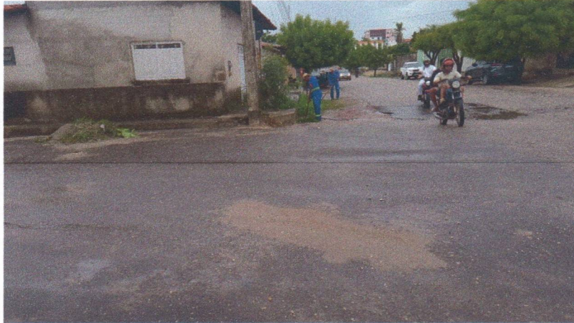
Imagem 05 – equipe realizando limpeza de ruas (varrição e remoção de entulhos), limpeza manual de vegetação em vias públicas e bota fora.