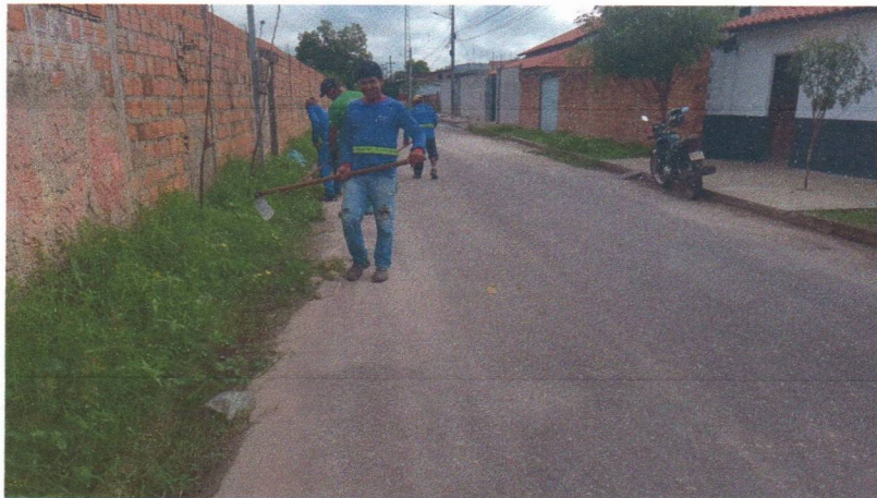
Imagem 06 – equipe realizando limpeza de ruas (varrição e remoção de entulhos), limpeza manual de vegetação em vias públicas e bota fora.