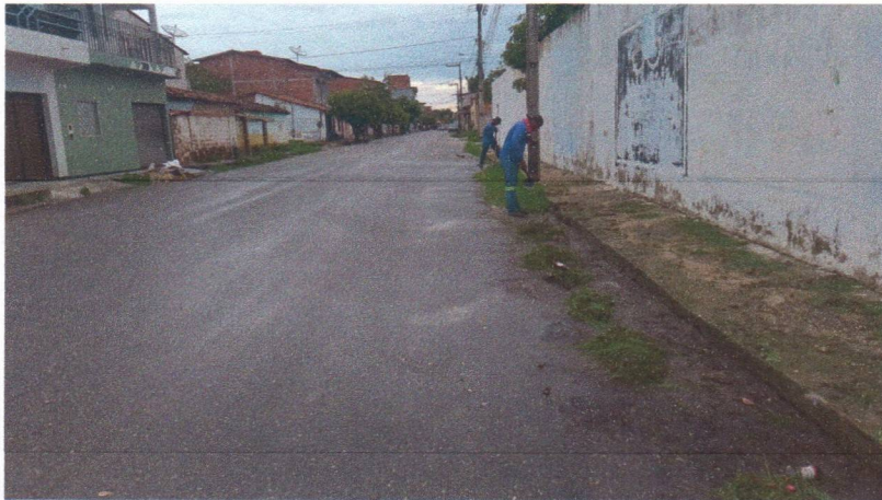
Imagem 06 – equipe realizando limpeza de ruas (varrição e remoção de entulhos), limpeza manual de vegetação em vias públicas e bota fora.